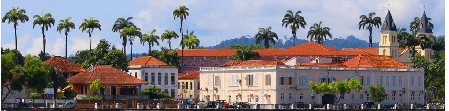
Foto: Die Hauptstadt Cidade de São Tomé. Vorige Seite: Strand auf Äquatorinsel Rolas.