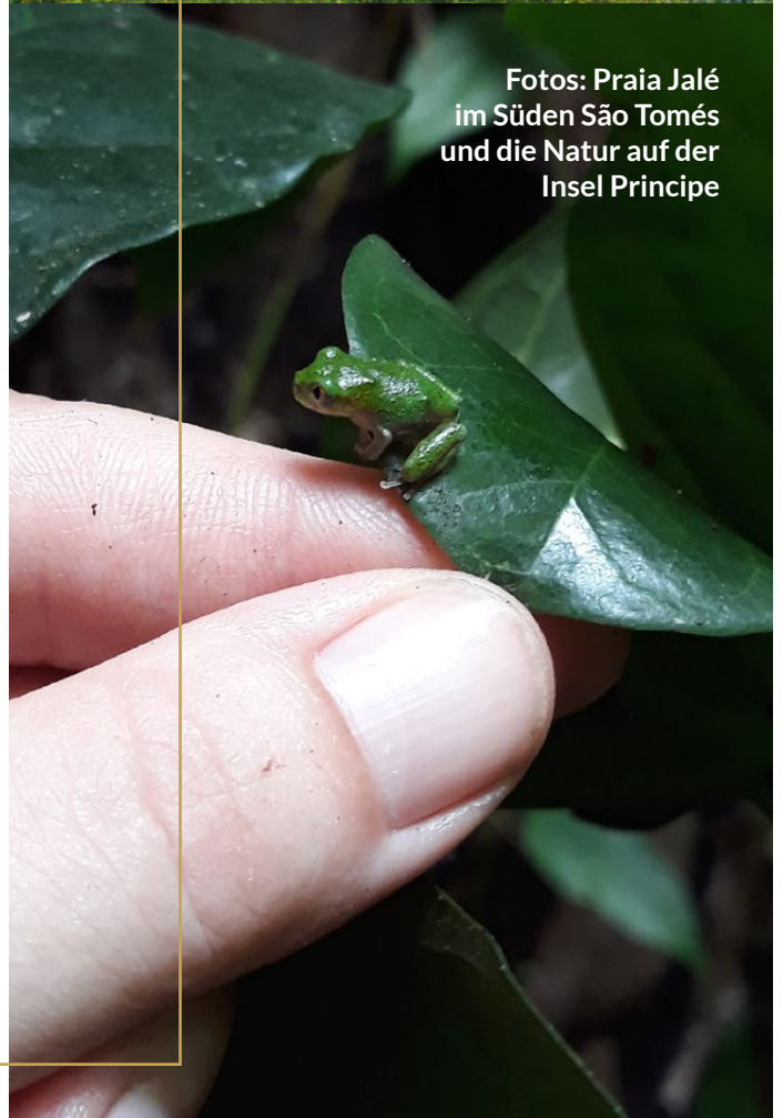
Fotos: Praia Jalé im Süden São Tomés und die Natur auf der Insel Principe